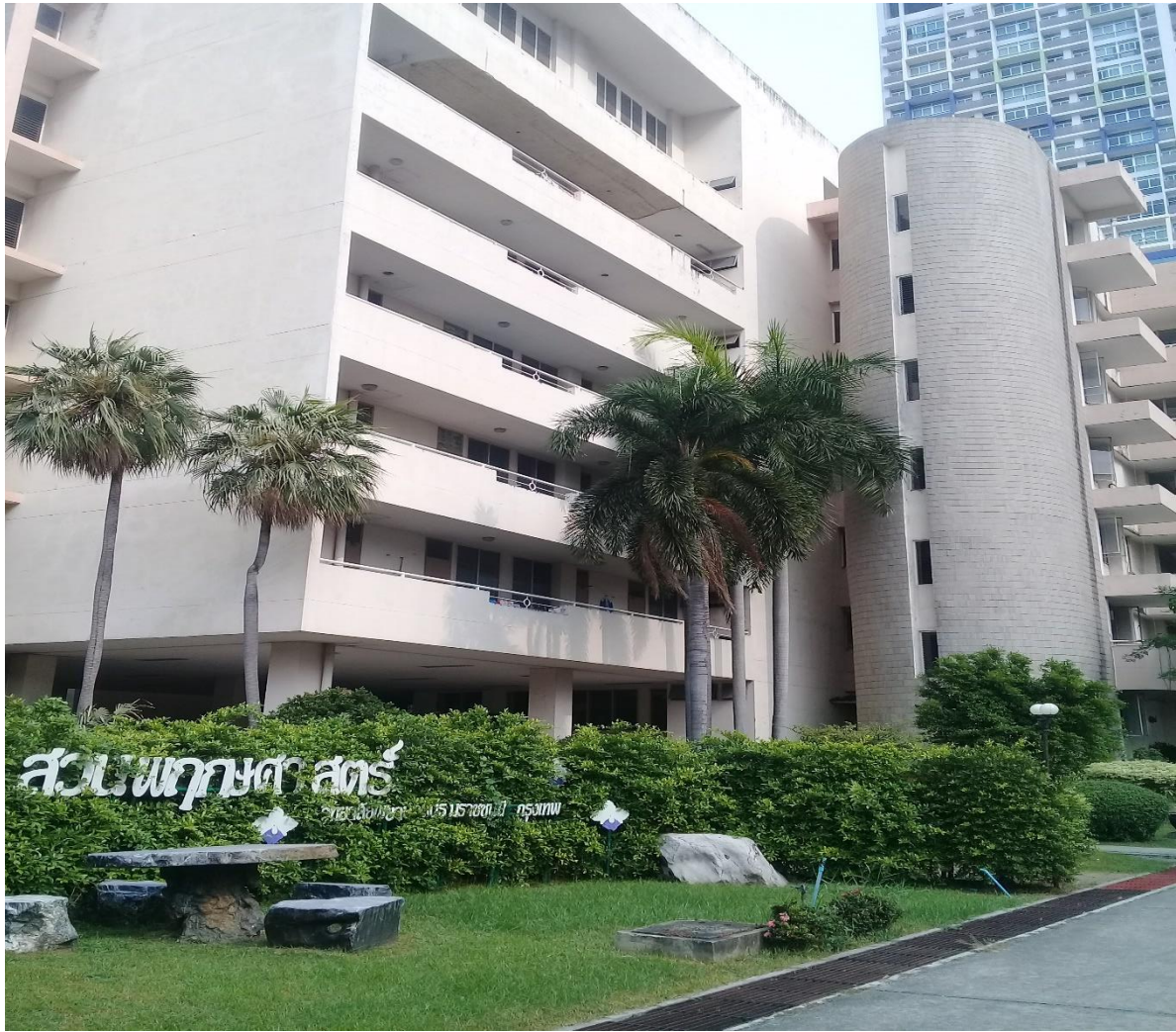
อาคารมณี สหสถานนท์